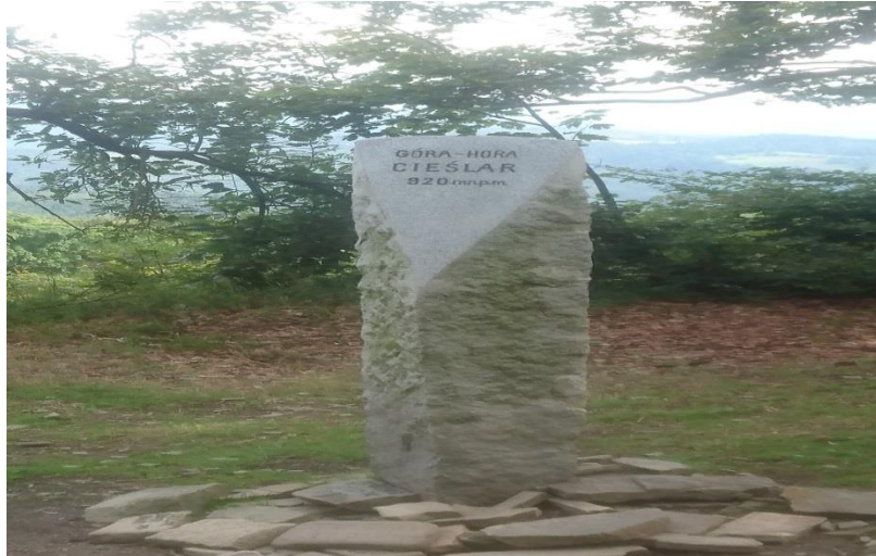
Kolejna góra zdobyta 😊