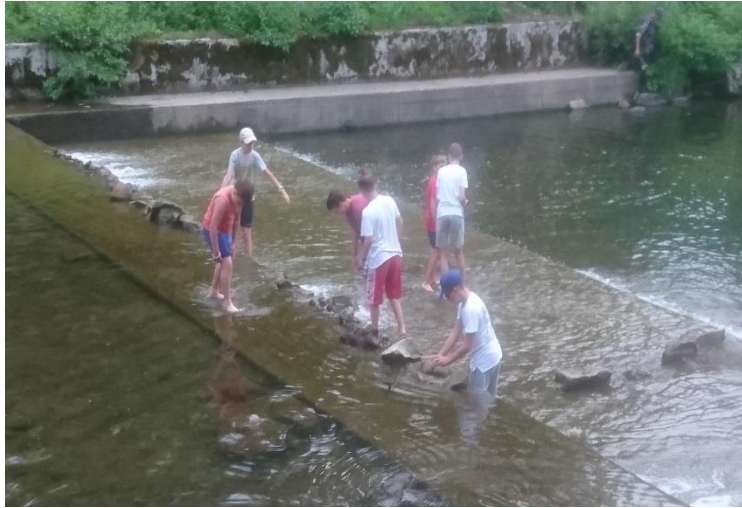
Trochę wody dla ochłody :)