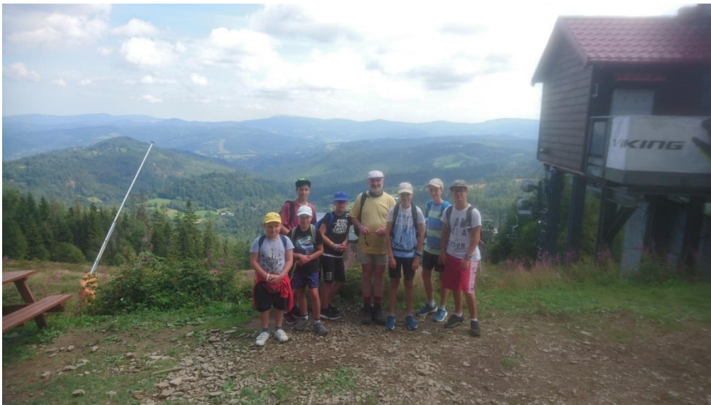
Wielki Stożek zdobyty :)