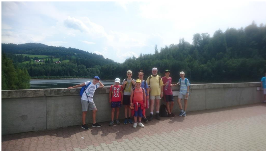
Zapora nad Wisłą