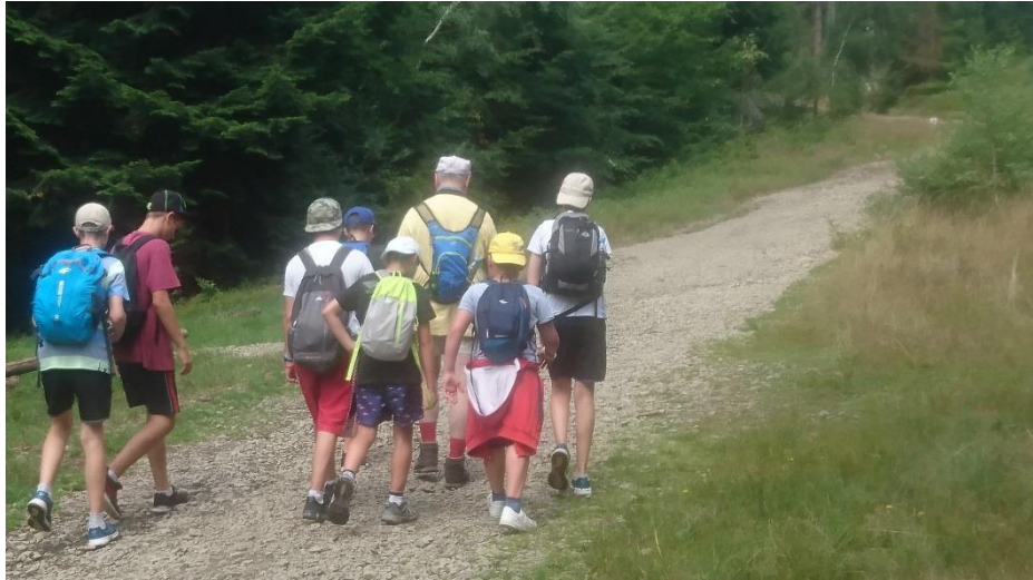
W drodze na Mały Stożek...