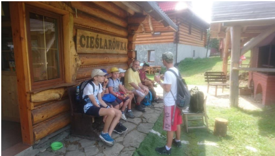
Krótką przerwą na małe co nie co :)