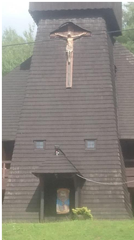
Kościół Znalezienia Krzyża Świętego w Wiśle