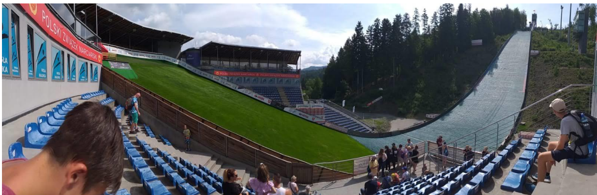
Skocznia narciarska im. Adama Małysza w Wiśle