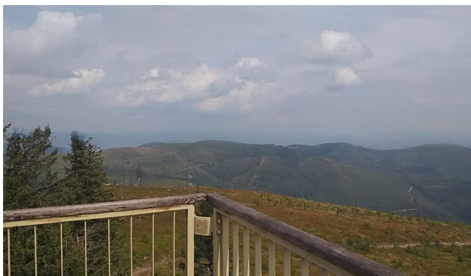
Panorama z Baraniej Góry